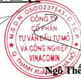
Ngô Thế Phiệt